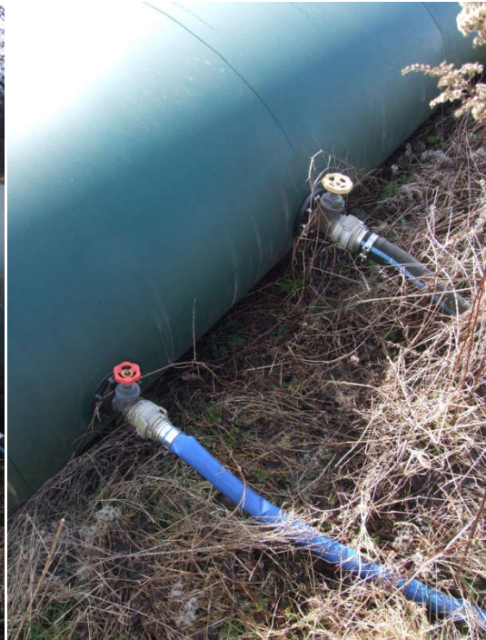
Vannes de remplissage et prise d'eau