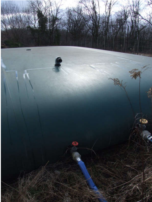
Poche à 1/2 du remplissage